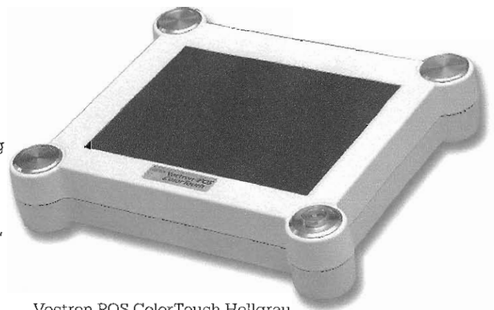
Vectron POS ColorTouch Hellgrau