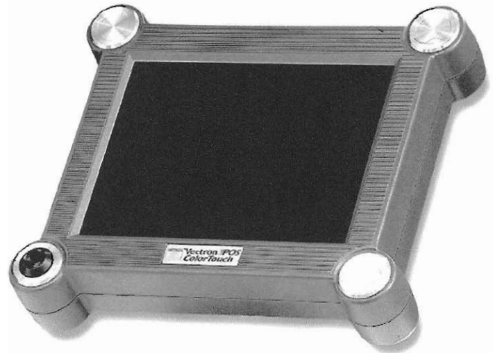
Vectron POS ColorTouch Anthrazit